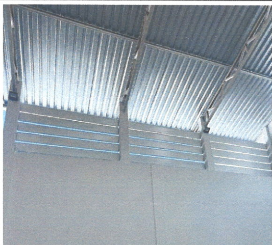
FOTO185: Instalação e pintura dos brises