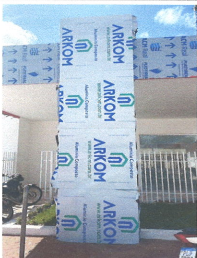
FOTO183: Alumínio composto (ACM)