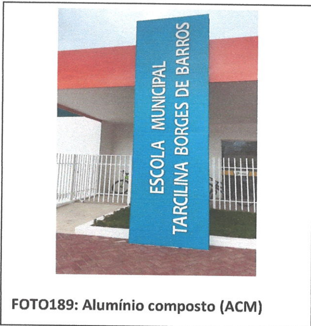
FOTO189: Alumínio composto (ACM)