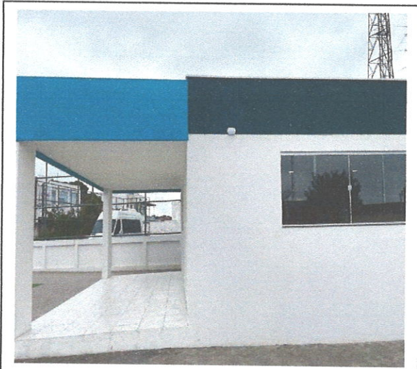
FOTO187: Esquadrias de vidro